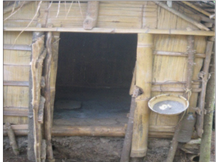
Latrine avec dispositif LMS