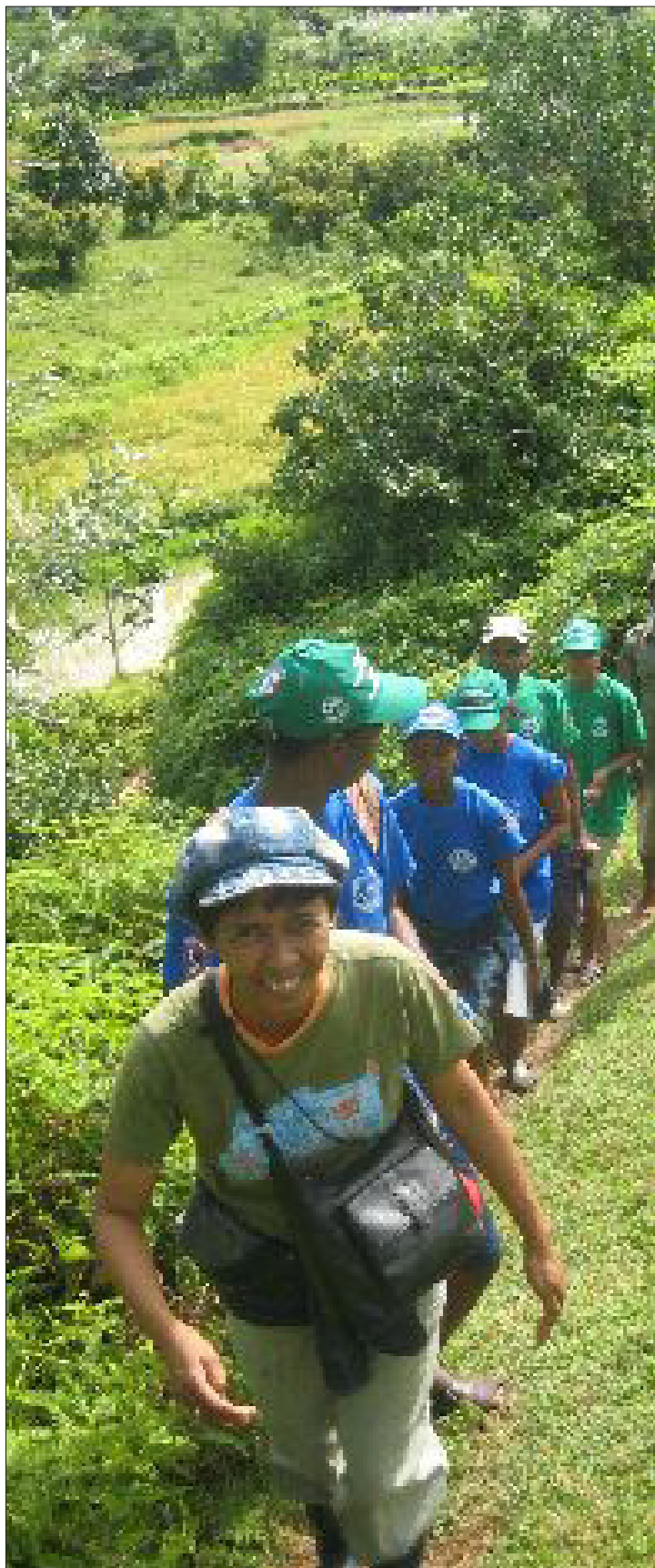
Suivi des sites CLTS avec l'équipe de l'ONG Frères Saint Gabriel

Le passage vers le statut de site ODF, nécessite d'importants suivis de la part de la communauté. Ces suivis doivent se faire le plus tôt et le plus souvent possible.