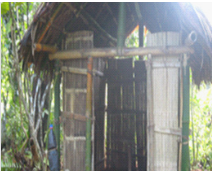
Eau ferreuse pour le cas d'Analatsara

Il peut exister des points d'eau au sein de la communauté mais parfois ceux-ci sont parfois non fonctionnels ; il existe des réseaux de maintenance qui peuvent nous aider de manière à ce que ces points d'eau soient fonctionnels.