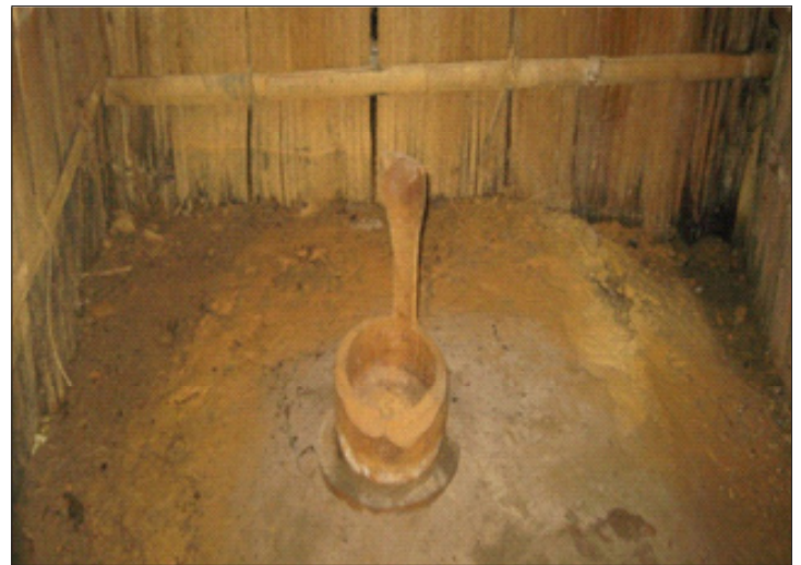
Type de couvercle utilisé selon les matériels locaux existants