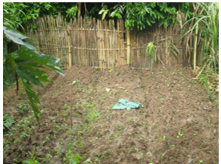
Zone de défécation à l'air libre devenu zone de plantation

Les zones de défécation à l'air libre sont devenues des sources de revenus pour les familles.