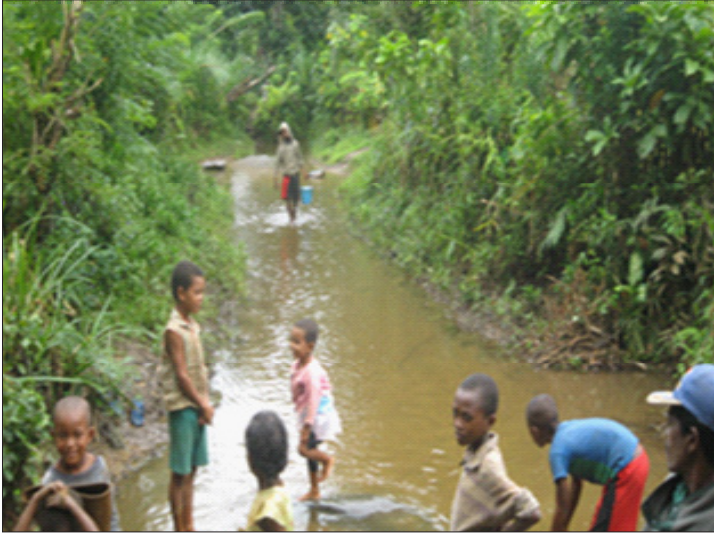
Source d'eau à Anivorano

Les sources d'eau ne sont pas potables. L'eau est utilisée à la fois pour la consommation, la lessive et les toilettes. Elle doit être traitée à domicile.